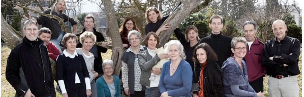
«Das Team der reformierten Kirche freut sich über Ihren Besuch; hier in der Kirche, bei unseren Veranstaltungen und anderswo. Wir sind da!»

Mitten im alten Dorfkern liegen die Gebäude der Kirchgemeinde Belp: die Kirche, das alte Pfarrhaus mit der Kirchenverwaltung, die Pfrundscheuer und der Friedhof. Ein Wegweiser weist Besucher/innen ein. Ein Glasschild neben der Kirchentüre grüsst: «Die Kirche ist offen.» Im Vorraum geht das Licht an, der Blick fällt auf ein grosses, farbiges Foto: