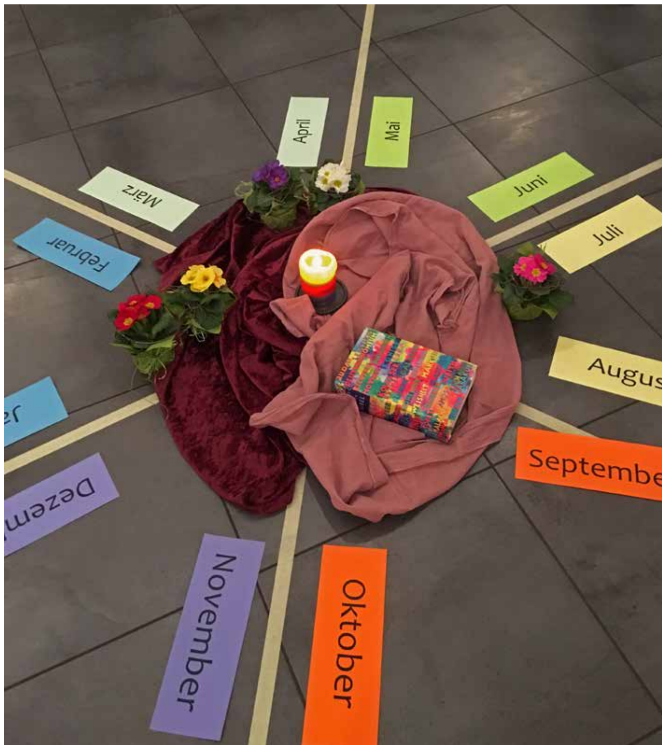
Muster für einen Jahreskreis (Anregung)